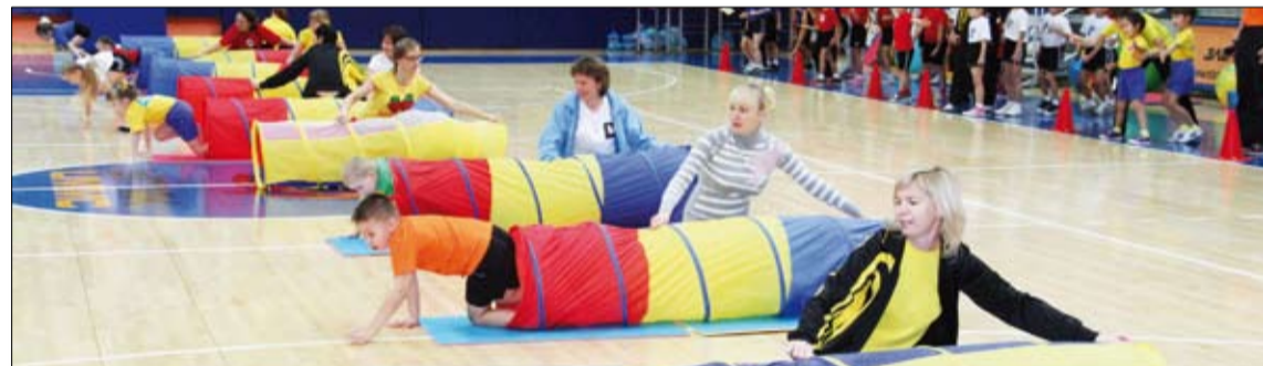
На четвереньках сквозь тоннель — к победе!