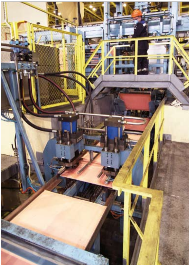
Отсюда готовые катоды уходят потребителю.

вышаем плотность тока, и таким образом должны подойти к максимальной производительности, которую может дать цех.