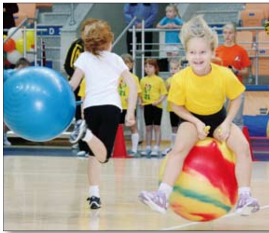
Это не состязания, а праздник!

родная расторопность помогала лихо маневрировать между неподвижными препятствиями, то огромные мячи некоторым спортсменам так и не поддались.