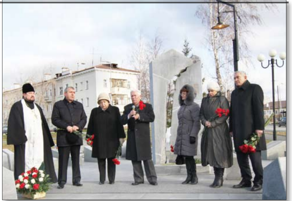
Память о жертвах политических репрессий почтили минутой молчания.